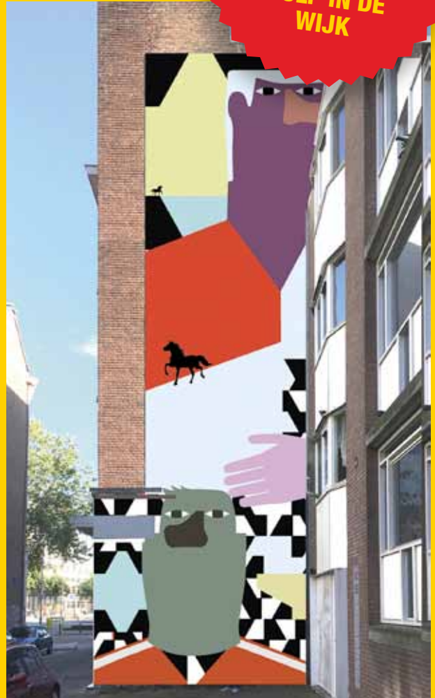
Muurschildering Zwartepaardenstraat. Kleur in de Corona tijd!

Het is op dit moment eigenlijk niet voor te stellen, maar er komt een periode na Corona. Het is logisch dat we daar nu niet mee bezig zijn. Alle aandacht gaat terecht naar de zorg. Er staan grote veranderingen in de wijk voor de deur. Om met deze veranderingen om te gaan, hebben we een aantal uitgangspunten voor het ontwikkelen van de wijk gemaakt. Deze uitgangspunten hebben we Coolregels genoemd. We hebben deze regels in zes bijeenkomsten tussen november en februari gemaakt in samenwerking met bewoners, ondernemers, mensen die de nieuwbouw gaan ontwikkelen, kunstinstellingen en mensen van de gemeente. Er werkten zo'n 100 mensen aan mee. We zijn benieuwd wat de andere bewoners van Cool vinden van de Coolregels. Vul daarom deze enquête in!